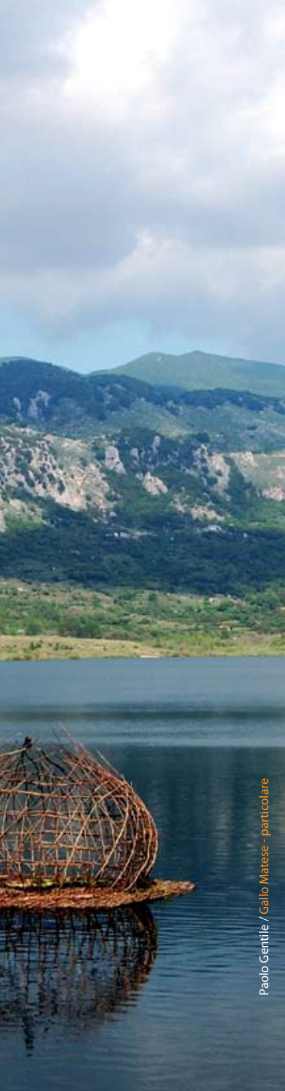
Paolo Gentile / Gallo Matese - particolare