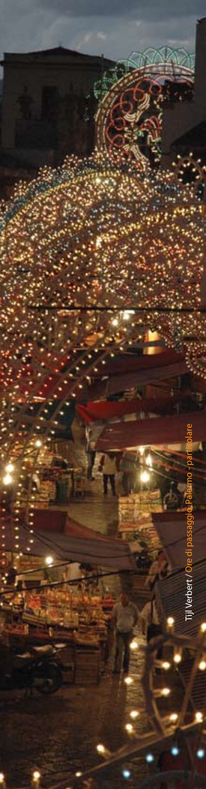
Tijl Verbert / Ore di passaggio, Palermo - particolare