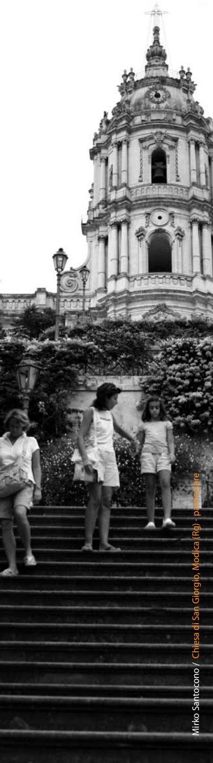
Mirko Santocono / Chiesa di San Giorgio, Modica (Rg) - particolare