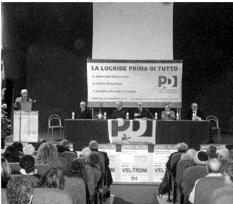
Da sinistra Tuccio, De Sena, Veltroni, De Maria, Laganà e Borgomeo

«Il Partito Democratico calabrese - ha detto Veltroni - deve uscire al più presto da questa situazione di incertezza e di stallo». Il Pd in Calabria è commissariato e a giorni si attende l'arrivo del nuovo commissario per l'organizzazione dei congressi. «In breve tempo - ha aggiunto - bisogna restituire ai calabresi un Pd solido ed unito». L'impegno è di costruire una piattaforma nazionale che parta dalle esigenze della gente e dei territori e per riuscirci, ha evidenziato Veltroni, «innanzitutto sforzarsi ad eliminare gli elementi di squilibrio che frenano un processo di sviluppo». In quest'impegno rientra anche quello di «far diventare la piattaforma della Locride una piattaforma nazionale» coinvolgendo «più soggetti politici che abbiano i piedi e il cuore nel territorio». Non a caso Veltroni ha sottolineato che «il partito che sotto è un partito aperto, una sorta di cabina di regia che riesce a mettere insieme tante sensibilità differenti, tanti soggetti non necessariamente appartenenti a un unico partito». ◀